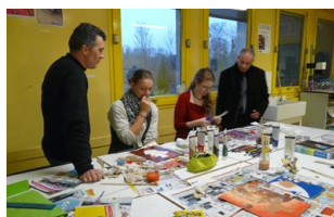
Atelier peinture acrylique

lesquelles ils se sont inscrits. Le choix proposé était vaste en passant par des ateliers d'infographie, d'activités manuelles, d'arts et de cuisine, etc., auxquels s'ajoutaient trois visites différentes et la possibilité d'aller voir une pièce de théâtre. Cette semaine a été fortement appréciée par une grande majorité des élèves malgré les perturbations dues à une météo peu clémente en fin de semaine. [AP]