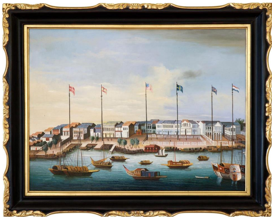
China Trade Painting The Hongs at Canton, Circa 1820